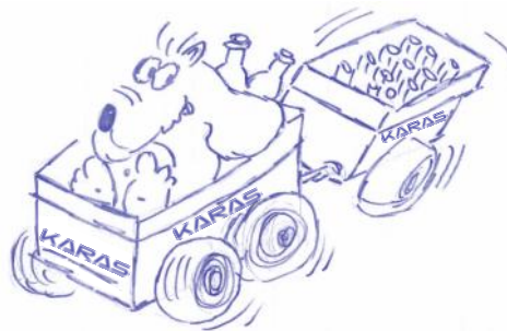
„DER KARAS“ © by Klaus Scherbach

Haftungsausschluß: Alle Rechte an Design, Text, Bildmaterial vorbehalten. Nachdruck, auch auszugsweise ist untersagt bzw. bedarf der Genehmigung. Keine Haftung für Irrtümer & Druckfehler. Alle Rechte bleiben beim Urheber bzw. Verfasser. © Getränke KARAS Vertriebs GmbH, Februar 2010